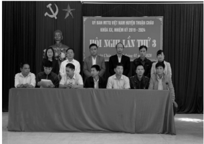
Ủy ban MTTQ Việt Nam các xã, thị trấn ký kết giao ước thi đua năm 2020.

địa phương. Đã thành lập 15 Đoàn công tác của huyện dự Ngày hội đại đoàn kết các dân tộc; triển khai có hiệu quả Cuộc vận động “Toàn dân đoàn kết xây dựng nông thôn mới, đô thị văn minh”; Cuộc vận động “Người Việt Nam ưu tiên dùng hàng Việt Nam”. Cùng với đó, MTTQ huyện đã thực hiện có hiệu quả các hoạt động an sinh xã hội như tổ chức thăm hỏi, tặng quà các gia đình chính sách, gia đình nghèo có hoàn cảnh đặc biệt khó khăn. Từ nguồn Quỹ “Vì người nghèo” của huyện, trong năm đã xây dựng được 11 nhà “Đại đoàn kết”, hỗ trợ sửa chữa 07 nhà cho các hộ có hoàn cảnh đặc biệt khó khăn; hỗ trợ kịp thời cho 09 hộ bị thiệt hại do mưa lốc tại các xã bị ảnh hưởng. Bên cạnh đó, Ủy ban MTTQ Việt Nam huyện đã phối hợp với Thường trực HĐND, UBND huyện tổ chức các cuộc tiếp xúc cử tri của đại biểu Quốc hội, Tổ đại biểu HĐND tỉnh, Tổ đại biểu HĐND huyện tại các xã, thị trấn. Ban Giám sát đầu tư của cộng đồng và các tổ hòa giải đã thể hiện rõ