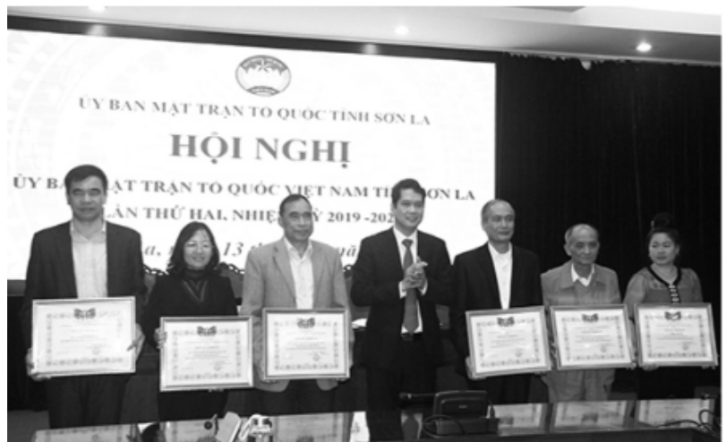
Lãnh đạo Ủy ban MTTQ Việt Nam tỉnh tặng Bằng khen cho các tập thể.

Tại Hội nghị, các đại biểu đã được thông tin một số kết quả nổi bật trên các lĩnh vực chính trị, kinh tế, văn hóa, xã hội của tỉnh năm 2019 và mục tiêu, nhiệm vụ, giải pháp trọng tâm năm 2020; kết quả công tác giám sát của