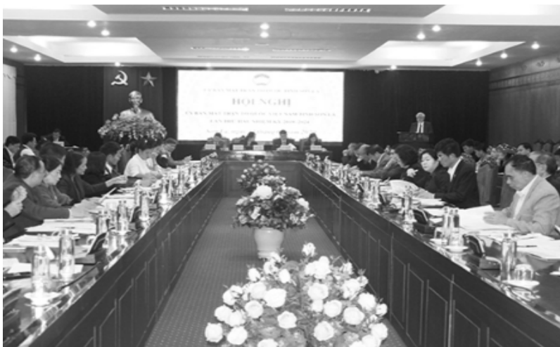
Hội nghị Ủy ban MTTQ Việt Nam tỉnh lần thứ hai khóa XI, nhiệm kỳ 2019-2024.

N gày 13/01, Ủy ban MTTQ Việt Nam tỉnh đã tổ chức Hội nghị Ủy ban MTTQ Việt Nam tỉnh lần thứ hai, khóa XI, nhiệm kỳ 2019-2024, đánh giá công tác Mặt trận năm 2019, triển khai chương trình phối hợp và thống nhất hành động năm 2020.