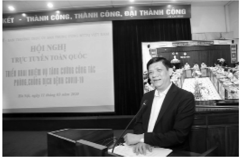
GS.TS Nguyễn Thanh Long, Thứ trưởng Bộ Y tế phát biểu tại Hội nghị.

Hiện nay, dịch Covid-19 đang lan rộng tới hơn 100 quốc gia, vùng lãnh thổ với diễn biến rất phức tạp, khó lường, tác động thiệt hại gây ra đối với phát triển kinh tế - xã hội và đời sống ngày càng nặng nề. Chính vì vậy cần sự vào cuộc của cả hệ thống chính trị để phòng, chống dịch Covid-19, trong đó, MTTQ và các tổ chức thành viên cần tập trung tuyên truyền vận động đoàn viên, hội viên và các tầng lớp nhân dân thực hiện phòng, chống dịch với phương châm phòng bệnh là chính.