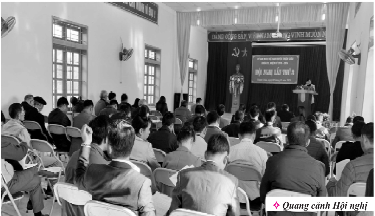
◆ Quang cảnh Hội nghị

Ủy viên Ban Thường vụ, Chủ tịch Ủy ban MTTQ Việt Nam huyện Thuận Châu