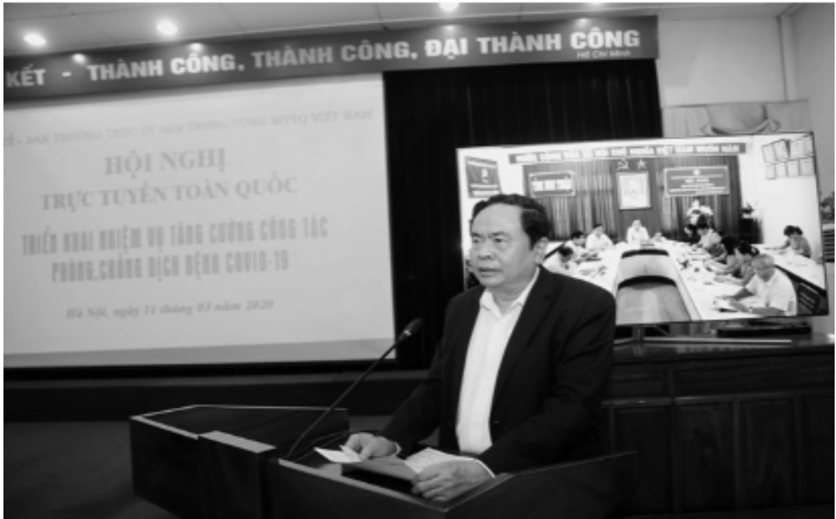
Chủ tịch UBTW MTTQ Việt Nam Trần Thanh Mẫn phát biểu tại Hội nghị.

Ngay sau Hội nghị, Ban Thường trực Ủy ban MTTQ Việt Nam tỉnh Sơn La đã quán triệt tới cán bộ, công chức trong cơ quan thực hiện nghiêm các biện pháp phòng, chống dịch theo hướng dẫn của Bộ Y tế; phun thuốc khử trùng, tổng vệ sinh toàn cơ quan; trang bị nước rửa tay tại các phòng làm việc; yêu cầu toàn thể cán bộ, công chức thực hiện đeo khẩu trang khi làm việc, hội họp; cắt giảm các cuộc họp, Hội nghị, ưu tiên tập