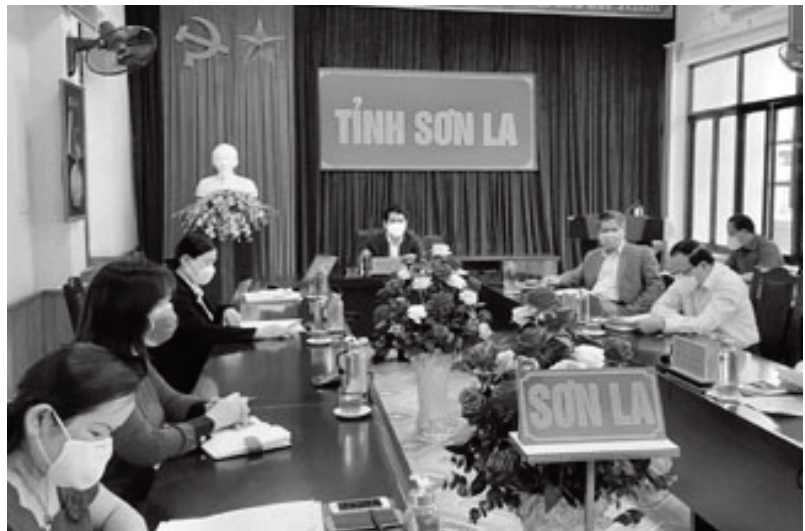
Các đại biểu dự Hội nghị tại điểm cầu tỉnh Sơn La.

Trước đó, ngày 31/01/2020 Ủy ban Trung ương MTTQ Việt Nam đã tổ chức Hội nghị trực tuyến toàn quốc để quán triệt, triển khai thực hiện nội