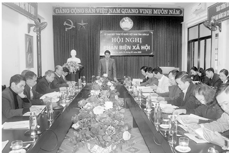
Đồng chí Vi Đức Thọ, Ủy viên BTV, Chủ tịch Ủy ban MTTQ Việt Nam tỉnh Chủ trì Hội nghị phản biện xã hội.

các tổ chức chính trị-xã hội tỉnh hiệp thương lựa chọn nội dung, chương trình giám sát, phản biện xã hội để báo cáo với Ban Thường vụ tỉnh ủy đưa vào chương trình chung về kiểm tra, giám sát hằng năm của tỉnh để có sự lãnh đạo thống nhất, toàn diện, tránh chồng chéo, trùng lặp. Trên cơ sở đó, Ban Thường trực Ủy ban Mặt trận Tổ quốc Việt Nam tỉnh xây dựng kế hoạch giám sát, phản biện xã hội của Mặt trận Tổ quốc Việt Nam và các tổ chức chính trị - xã hội tỉnh để thống nhất các nội dung thực hiện từ tỉnh tới cơ sở trong năm. Nhờ vậy, các nội dung giám sát luôn được thống nhất, tập trung vào các lĩnh vực cải cách hành chính, hoạt động quản lý Nhà nước về những lĩnh vực liên quan trực tiếp đến đời sống Nhân dân, quyền và lợi ích cơ bản của người dân, những vấn đề dư luận xã hội và Nhân dân quan