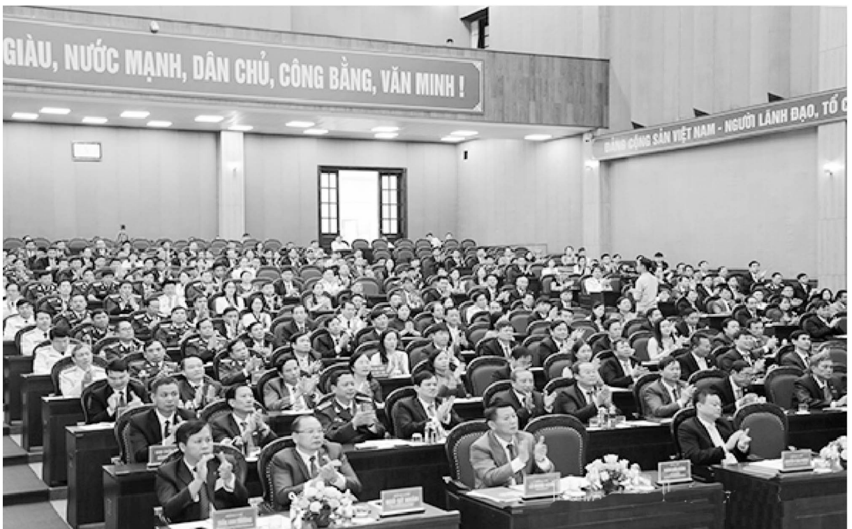
Các đại biểu dự Đại hội