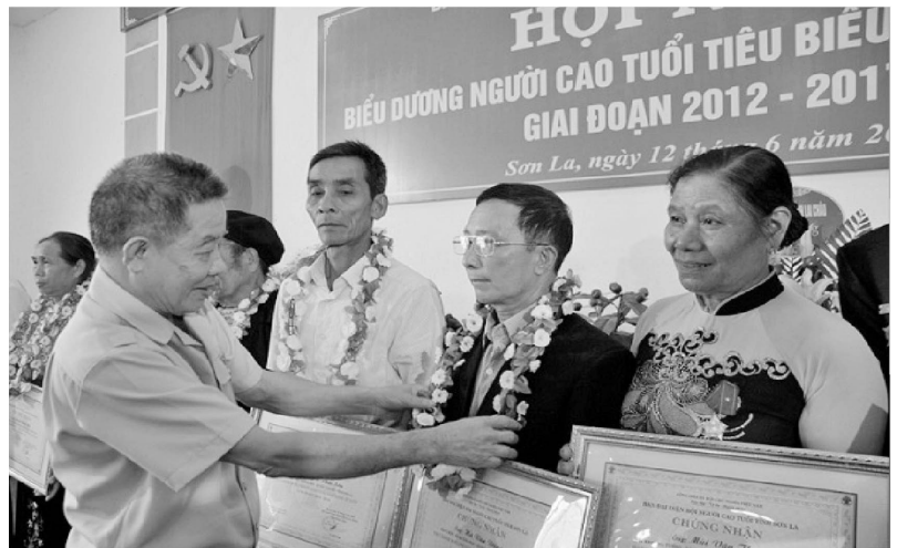
Biểu dương Người cao tuổi Yên Châu làm kinh tế giỏi.

Hưởng ứng các Cuộc vận động do Ủy ban Mặt