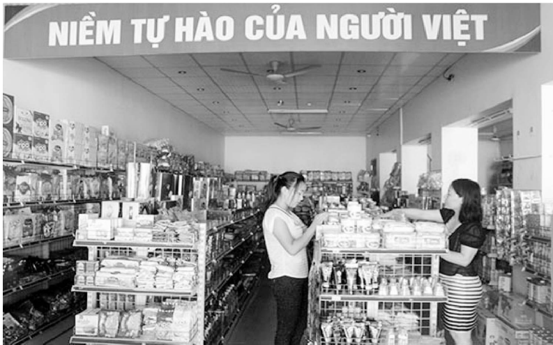
Người dân mua sắm tại điểm bán hàng Việt tổ 1, phường Chiềng Sinh, Thành phố Sơn La

các hoạt động phối hợp với các cơ quan liên quan, các doanh nghiệp tổ chức các hội chợ, các điểm bán hàng Việt lưu động tại các địa bàn dân cư... đã phối hợp tổ chức nhiều phiên chợ đưa hàng Việt về nông thôn, vùng sâu, vùng xa, vùng biên giới và các khu dân cư. Cuộc vận động đã góp phần thay đổi nhận thức của mọi người dân, phát huy mạnh mẽ lòng yêu nước, ý chí tự lực, tự cường, tự tôn dân tộc, xây dựng văn hóa tiêu dùng của người Việt Nam. Tuyên truyền, vận động đoàn viên, hội viên và các tầng lớp Nhân dân tham gia phát triển các mô hình hợp tác xã kiểu mới, xây dựng chuỗi giá trị hàng hóa, đến nay có 640 hợp