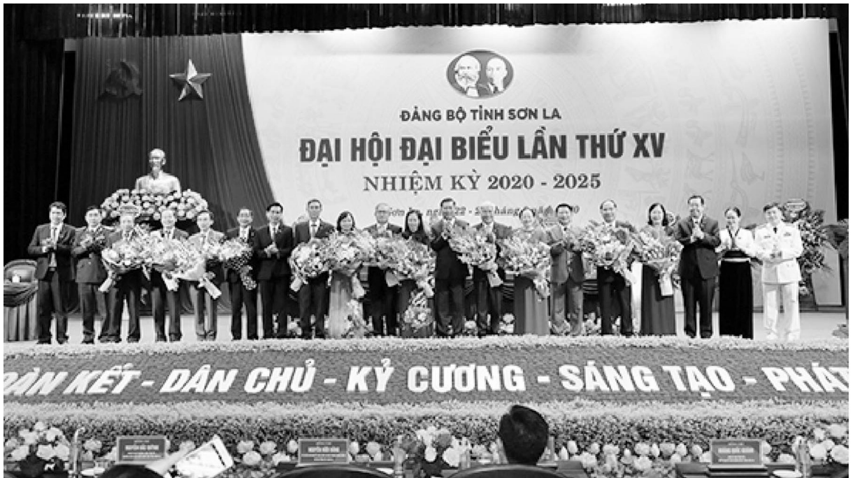
Ban Thường vụ tặng hoa các đồng chí thôi tham gia Ban Chấp hành khóa XV

luận các chỉ tiêu và giải pháp chủ yếu của nhiệm kỳ 2020-2025. Tập trung đẩy mạnh đổi mới, sáng tạo; phát huy tối đa các nguồn lực; khắc phục hạn chế, khó khăn, triển khai đồng bộ các nhiệm vụ. Trong đó, phát triển kinh tế - xã hội là trung tâm, xây dựng Đảng là then chốt, phát triển văn hóa là nền tảng tinh thần xã hội và bảo đảm quốc phòng, an ninh là trọng yếu, thường xuyên; giữ vững kỷ luật, kỷ cương, chủ động, sáng tạo và quyết liệt trong lãnh đạo, chỉ đạo; tạo bứt phá trong phát triển. Đại hội đã xác định 3 khâu đột phá trong nhiệm kỳ 2020-2025,