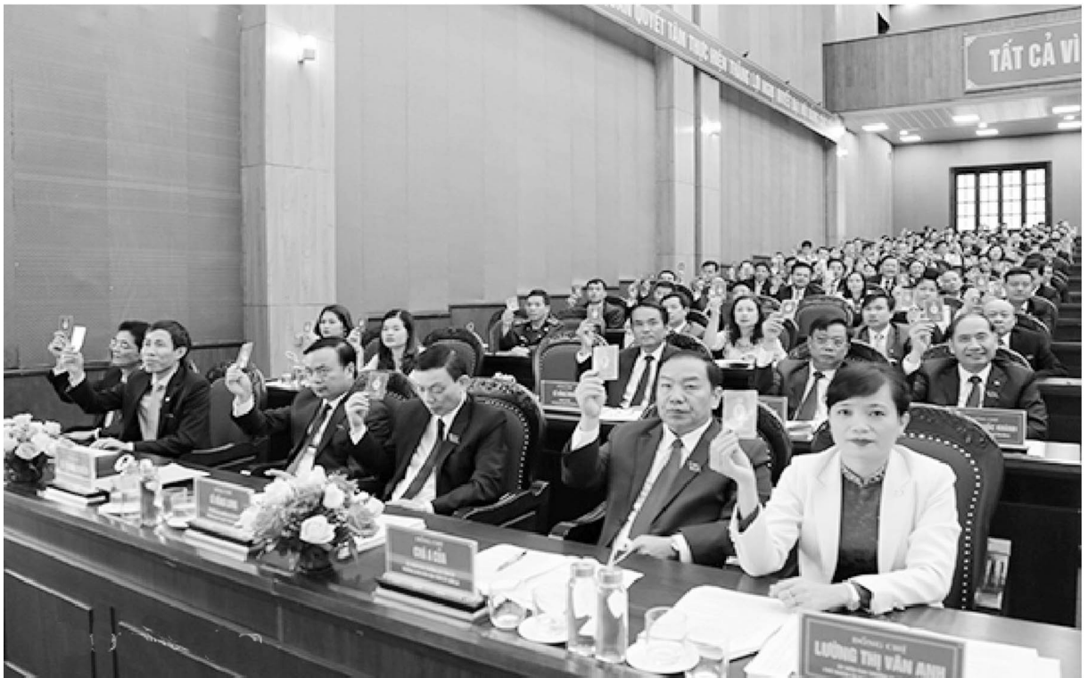
Các đại biểu biểu quyết thông qua Nghị quyết.