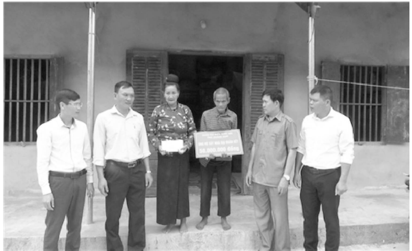
MTTQ thành phố Sơn La trao nhà Đại đoàn kết cho gia đình có hoàn cảnh khó khăn

Phối hợp với chính quyền, các tổ chức chính trị chính trị - xã hội vận động đóng góp được trên 8.487.000 đồng vào Quỹ “ Đền ơn đáp nghĩa ”, quan tâm chăm lo đời sống cho các thương binh, bệnh binh, gia đình liệt sỹ và người có công với cách mạng; phối hợp thực hiện